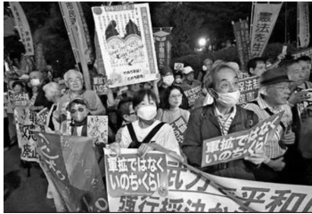
国会正門前 9月19日 「武力で平和は作れない」

た。参加した2300 人が「武力で平和はつ くれない」と横断幕を 掲げ、「戦争法は今すぐ